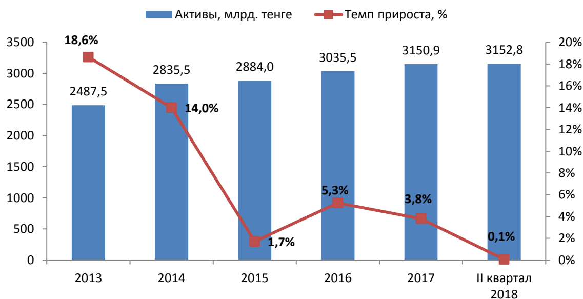
График 1. Динамика активов Эмитента

Общие активы АО «НК «КТЖ» за II квартал 2018 год выросли на 0,1% и по состоянию на 01 июля 2018 года составили почти 3 152,8 млрд. тенге, в сравнении с 3150,9 млрд. тенге по состоянию на 01 января 2018 года (см. График 1).