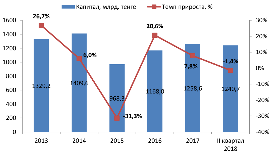
График 2. Динамика капитала Эмитента

На Графике 2 показано изменение капитала Эмитента за 2013-2017 гг. и за второй квартал 2018 года. Капитал Эмитента за 2017 год вырос на 7,8%. За первые шесть месяцев 2018 года капитал снизился на -1,4%.