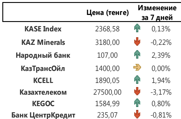
Изменение цен казахстанских акций за день